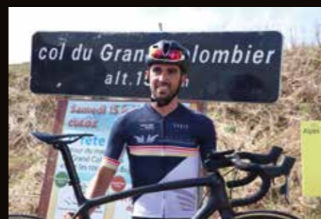
Alberto CONTADOR - ici au sommet du Grand Colombier - a participé à la cyclo sportive en 2019.

La proximité immédiate avec plusieurs pays frontaliers devrait internationaliser la participation à cet événement.