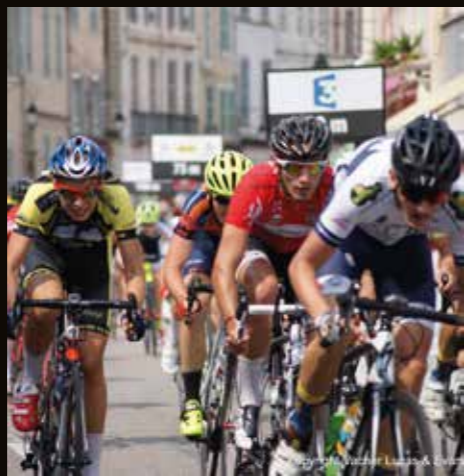
Chaque jour, les jeunes coureurs de 15-16 ans disputent le Tour de l'Ain Cadets.