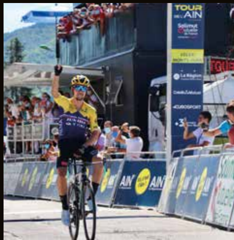
En préparation pour le Tour de France, Primož ROGLIČ - ici à Lélex Monts-Jura - a remporté 2 étapes et le classement final du Tour de l'Ain 2020.