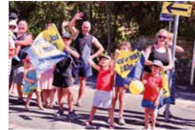
Sur le bord de la route, le public s'affiche aux couleurs du département de l'Ain !