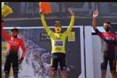
Podium final du Tour de l'Ain 2020 : 3 ème Nairo Quintana (Team Arkéa-Samsic), 1 er Primoz Roglic (Team Jumbo-Visma), 2 ème Egan Bernal (Team Ineos)