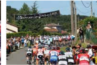
Les communes se mobilisent, animent et décorent les villages traversés.