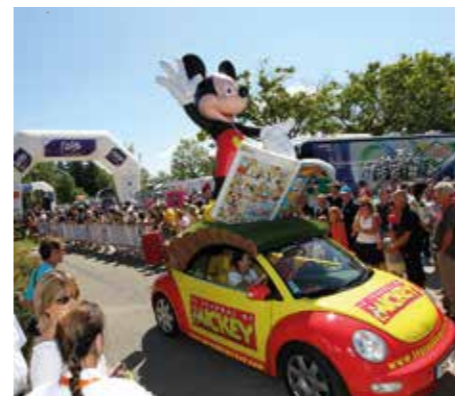
Certains véhicules du Tour de France participent également à la caravane du Tour de l'Ain.

Chaque jour, l'ensemble de la caravane publicitaire réalise une halte festive dans l'un des villages traversés !