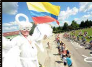
Passage de la course à Druillat : sur le Tour de l'Ain c'est aussi le public qui crée l'animation.