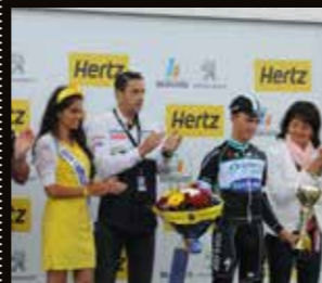
Première victoire professionnelle pour Julian ALAPHILIPPE sur le Tour de l'Ain 2014 à Arpent.