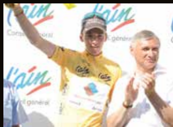
Romain BARDET : première victoire professionnelle sur le Tour de l'Ain 2013.