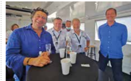
Laurent GERRA et Christian PRUDHOMME étaient présents lors du Tour de l'Ain 2020.