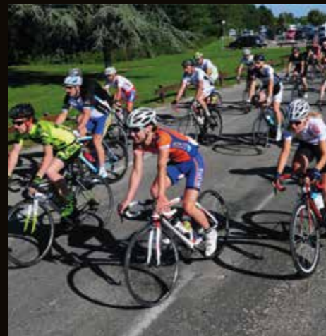
Événement «Vélo pour Tous», la cyclo sportive permet aussi de mettre en valeur les richesses touristiques du département de l'Ain.