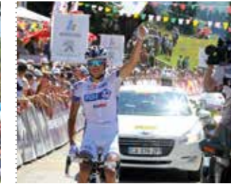
Première victoire professionnelle pour Thibaut PINOT à Bellignat sur le Tour de l'Ain 2011. Il a par la suite remporté les éditions 2017 et 2019.