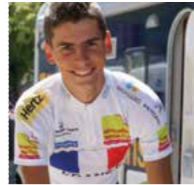
Warren BARGUIL remporte le classement du meilleur jeune sur le Tour de l'Ain 2011